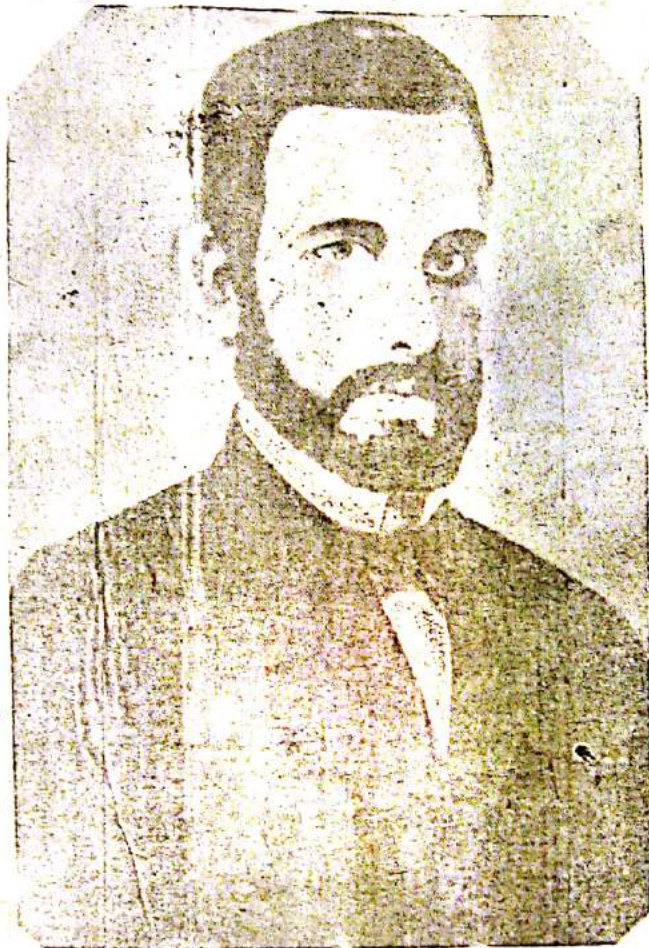
Conselheiro José Antonio Saraiva, o Fundador de Teresina

Regressando à sua terra natal, depois de formado, foi nomeado Promotor de Jacobina, município do alto sertão baiano. Após um ano no exercício desse cargo, recebeu a nomeação para Juiz, do mesmo Município, cargo que exerceu com excepcional espírito de retidão e justiça. Nessa época, em 1849, deixando o cargo de Juiz, cad-